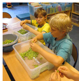
Laatste oogst van het jaar : de erwtjes. Geduld en precisie zijn vereist om ze te doppen.

In Vorst concentreren ze zich voortaan op fruitbomen (budget : 300 EUR), als laatste onderdeel van het project. De kinderen denken er al aan om een wingerd te planten en zo een groene pergola te maken om wat schaduw te hebben als het mooi weer is.