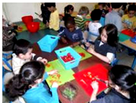
In Schaarbeek zijn er kleutertjes die planten terwijl er anderen koken.