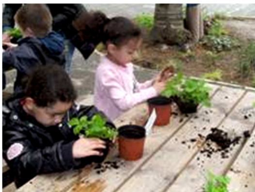
Je moet niet groot zijn om groene vingers te hebben (kleuterschool nr. 2)