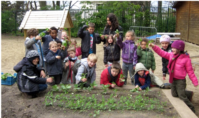
Eerste oogst van het jaar op de school Arc-en-ciel : kleurrijke radijsjes !

Resultaat : de twee scholen hebben perfect duurzame structuren ontwikkeld en hebben de moestuincultuur volledig in hun instellingen opgenomen, met alle educatieve voordelen die ermee gepaard gaan (kennis van de natuur, waardering van het werk, discipline, geduld, respect voor het milieu...). Enkele vierkante meter volstaan voor een volledige burgeropvoeding!